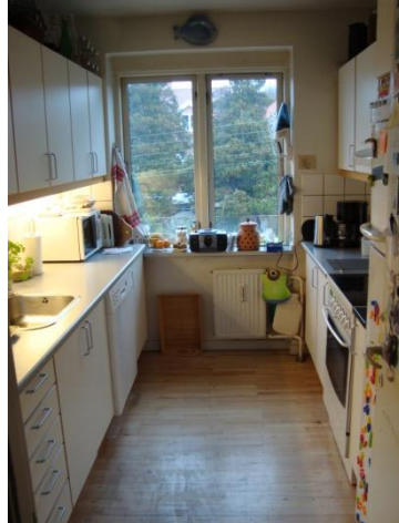
Køkken (nyt) ikke alle køkkener er nye